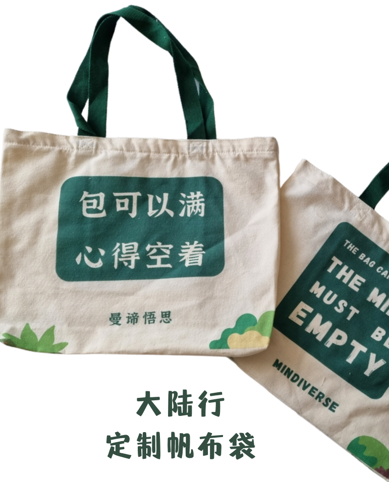
大陆行 定制帆布袋